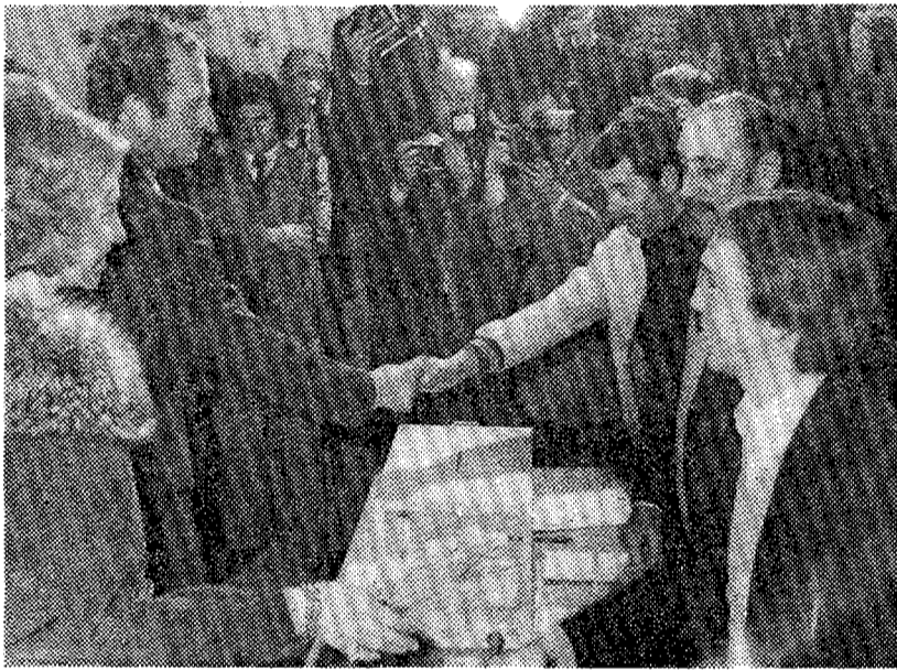
LOS REYES EMITEN SU VOTO EN UN COLEGIO DE EL PARDO

SI A LA REFORMA: 94,8% DE SUFRAGIOS LA MEDIA NACIONAL DE PARTICIPACION LLEGO AL 80,2 Y LA ABSTENCION AL 19,8 %