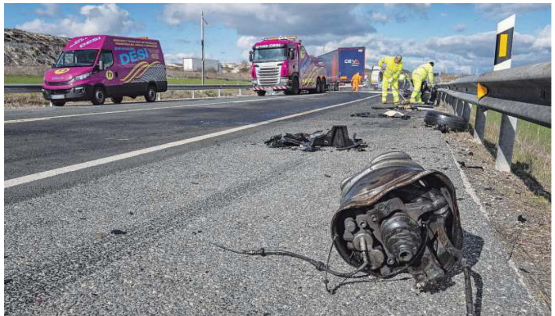
CUANDO TODO HA TERMINADO. Huellas de frenada y restos de vehículos. El accidente ha terminado, pero sus consecuencias acaban de empezar. Hay que afrontar daños físicos y materiales, y asuntos legales, psicológicos y sociales.

La DGT aclara que el 018 no es un teléfono de emergencias. Para eso están el 112 o los números de los servicios policiales y de urgencias sanitarias. Este es un servicio para la fase posterior al siniestro, que suele ser muy complicada porque es cuando hay que atender las dudas legales y las secuelas psicológicas. «Son momentos dramáticos en los que una atención telefónica especializada puede ayudar a reducir barreras como el miedo, la distancia geográfica, la falta de recursos económicos o el desconocimiento de los procedimientos disponibles», explica el ministro del Interior, Fernando Grande-Marlaska, que presenta el